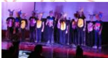
O Grupo de Educação Musical

Preparem-se, pois, para o próximo ano haverá mais.