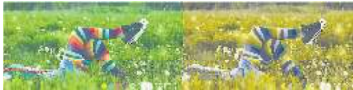
O depois e o antes com os óculos Enchroma

normal das mesmas. Os cones (células especializadas na acuidade da visão diurna e em reconhecer a cor) recebem sinais sobrepostos provocando assim dificuldades em conseguir distinguir certas cores. Por exemplo, tons de vermelho, castanho e verde podem parecer muito similares. Pode fazer o teste de daltonismo no site da Óptica Barreto ( www.opticabarreto.com ), sendo que há quatro passos que têm que ser dados: 1) Determinar o tipo de cor que não distingue; 2) Identificar prioridades e tipo de lentes; 3) Experimentar as lentes; 4) Escolher o estilo de óculos Enchroma. Pessoas com óculos graduados também podem mandar fazer os seus óculos Enchroma.