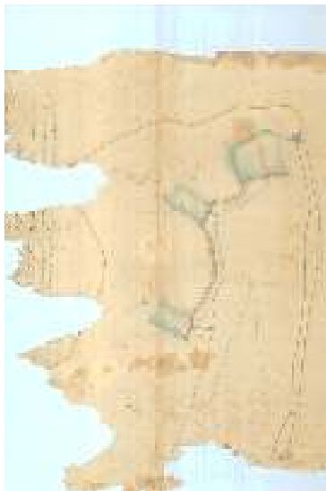
Projeto Irrigação Sete Montes