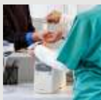
Pulseiras de Identificação