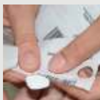
Medicamentos em Unidose